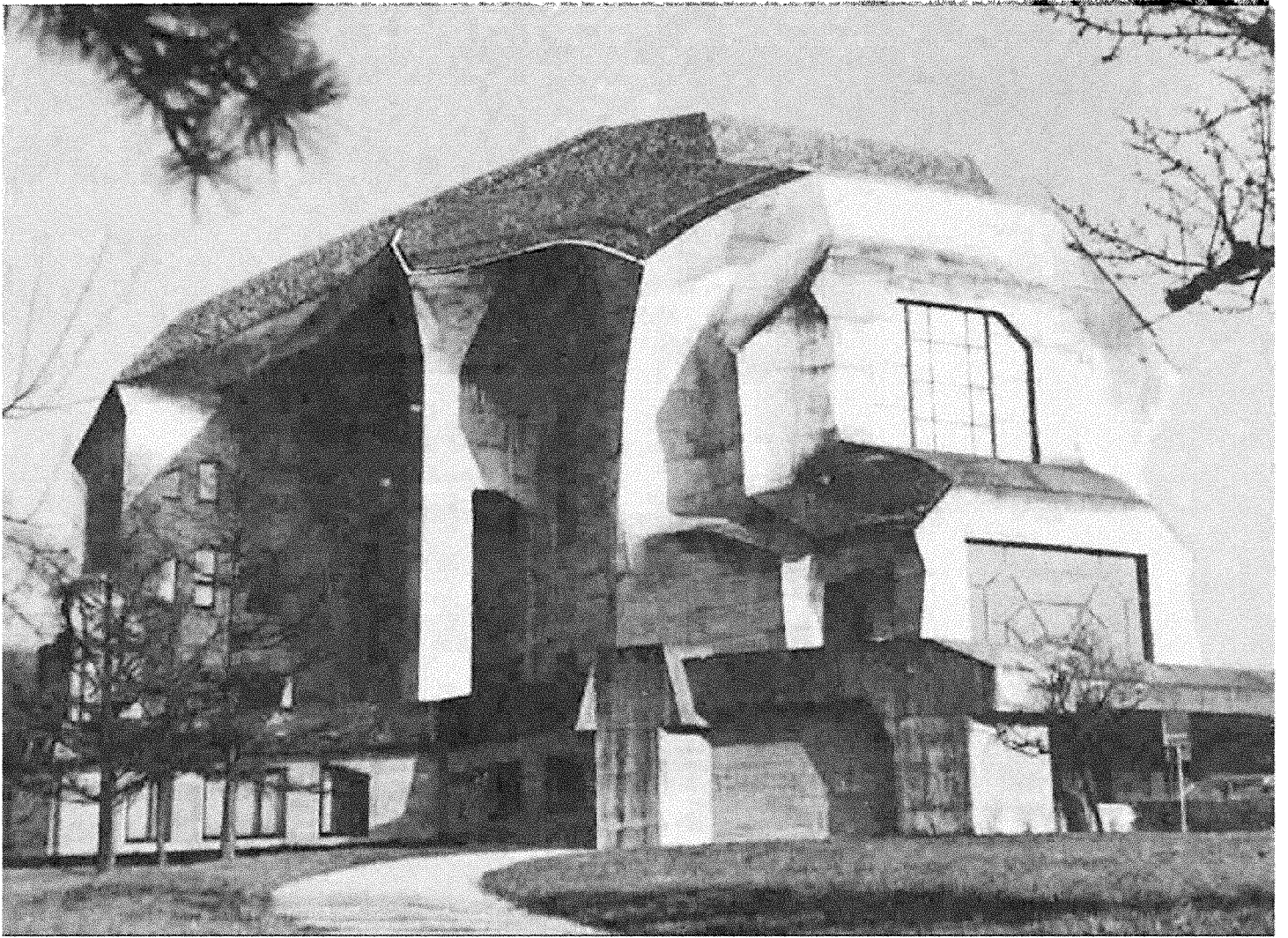
Der ausgeführte Bau von Südwesten