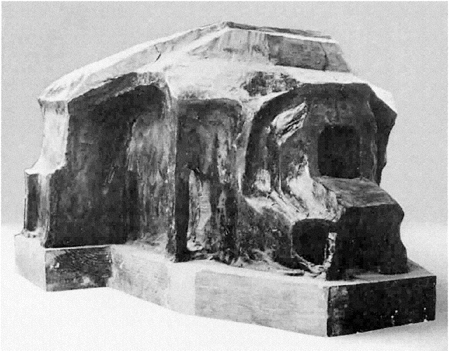
Das Plastilin-Modell Rudolf Steiners aus dem Jahre 1924 für das zweite Goetheanum (Höhe 33 cm, ohne Sockel)